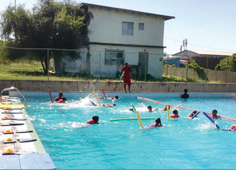
Zwemles op Sint Eustatius • Foto: Stephanie van der Heiden-Derksen

‘HET LIJKT WEL OF WIJ DE KINDEREN ELKE WEEK EEN NIEUW CADEAUTJE GEVEN, ZO VROLIJK ZIJN ZE WANNEER ZE HIER ARRIVEREN.’