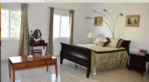
De Bed & Breakfast van de school