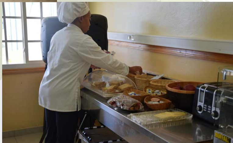
Het schoolontbijt is beschikbaar voor alle leerlingen