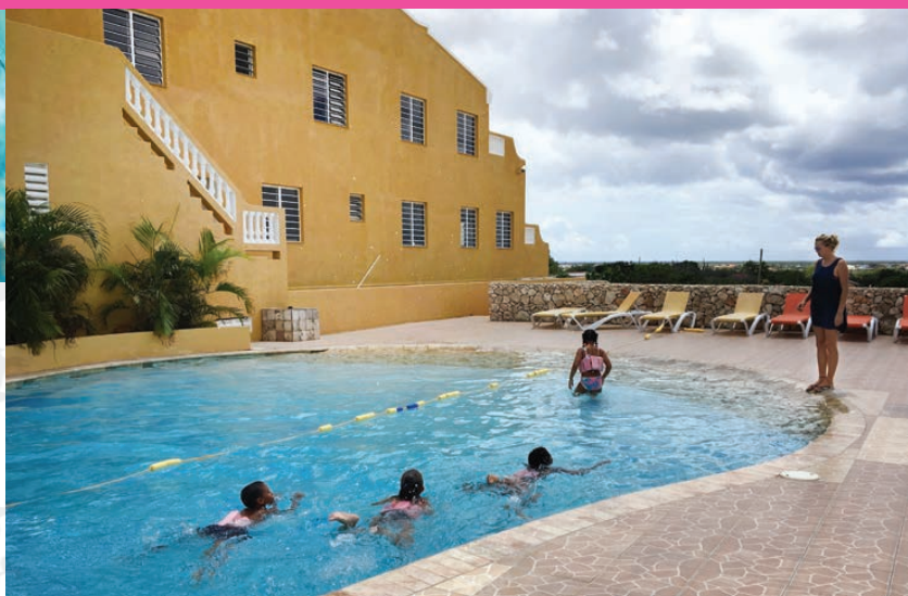
Zwemles op Bonaire

Al sinds november 2016 organiseren de Sint Eustatius Sports Facility Foundation (SSFF) en de Sint Eustatius Swimming Association (SESA) zwemlessen voor leerlingen van de groepen 3. Na de orkaanperiode in september 2017 wordt er een inhaalslag gemaakt. De leerlingen van groep 4 en 8 krijgen nu ook les, zodat in 2018 alle kinderen die de basisschool afronden, hun zwemdiploma A hebben. Veiligheid en kwaliteit staan in dit project voorop.