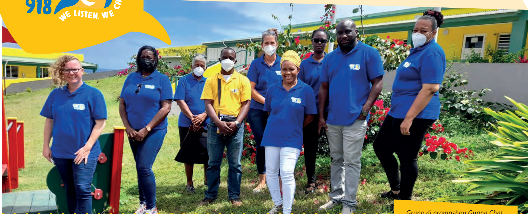
Grupo di promoshon Guana Chat

GUANA CHAT 918 WE LISTEN. WE CARE! CARE!