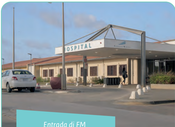
Entrada di FM

“Por ehèmpel, awor FM tin un poli pa reumatologia, medisina analgésiko, revalidashon i oftalmologia. Pa e pashènt